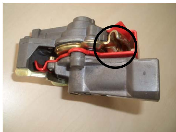
Haldex coupling head