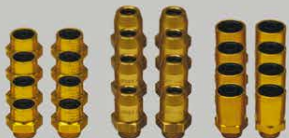
Kit raccords frein de parc 8 mm Référence SB8MM

Sélectionnez le kit raccords pour le circuit du frein de parc, à partir du diamètre des tuyaux actuellement utilisés pour ce circuit.